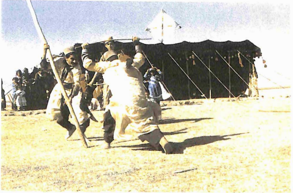
Ho oyunu oynayan gençler